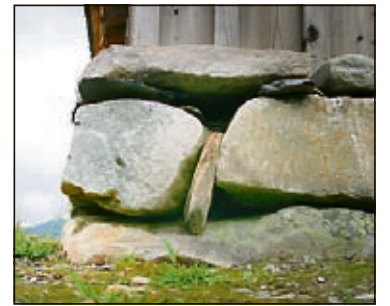
TØRRMUR: Selet står på en lav natursteinsmur, et godt eksempel på gjenbruk av lokal stein.