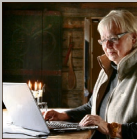
Agder fylkeskulturstipend og Bonytts veteranhuspris.