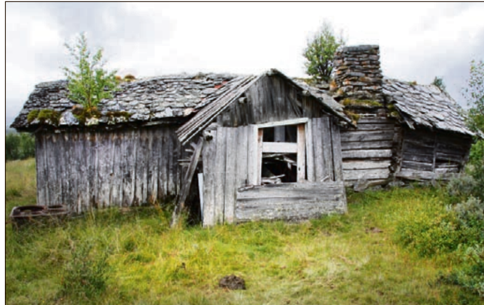
FØR RESTAURERING: Bjørkheimstølen før restaureringsprosjektet.