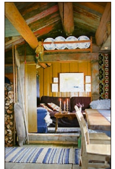
GJENBRUK: Gamle panelbord var spart fra andre hus ble brukt i taket. Else ville ikke male dette taket.