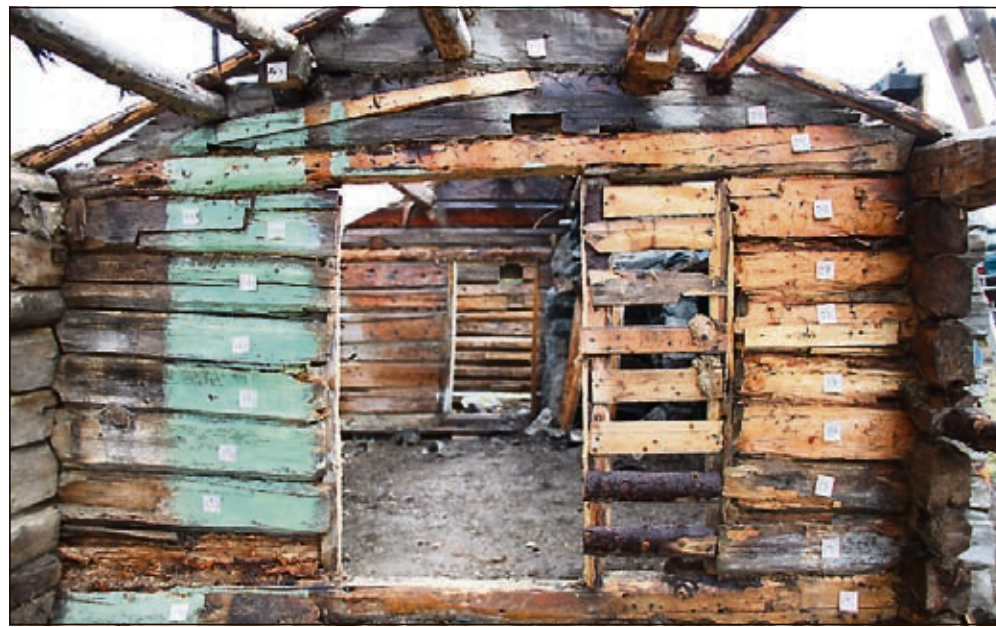
MERKING: Alle bygningsdeler ble merket.