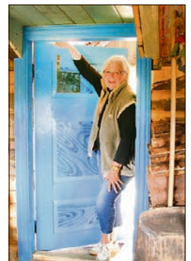
DØRSMYKKE: Døra ble røntgenfotografert hos en veterinær. Nå står døra som et smykke – slik den var når huset ble bygd.