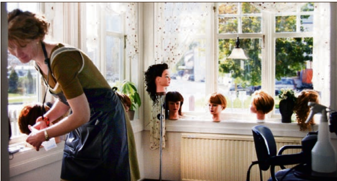
GLASSVERANDA: Veggen er åpnet for å slippe lyset inn i lokalene.