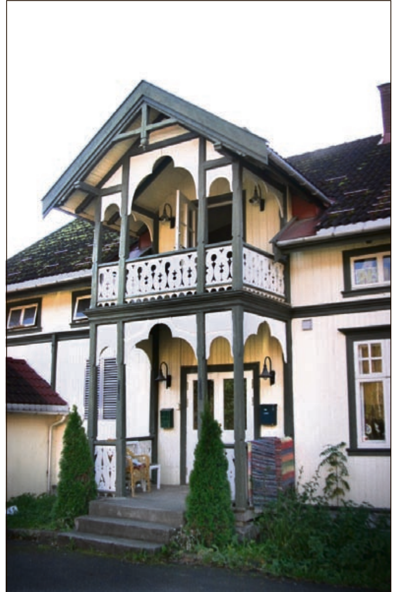
BAKSIDE: Inngangen til leilighet i andre etasje er vakkert utsmykket.