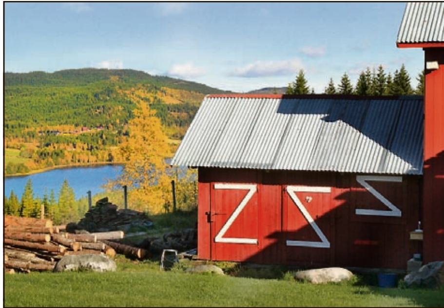
VEDSKJUL OG UTEDO MED UTSIKT: Det lille vedskjulet ble flyttet til låven gjennom dugnadsarbeid fra utenlandske studenter. Til gjengjeld fikk de en eksotisk ferie i Landåsbygda.