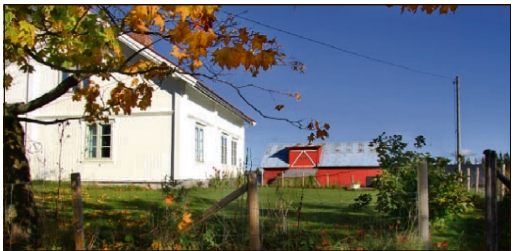
VANNBRETT: Ytterveggene ble delt med vannbrett for å kunne bruke opp igjen gammel panel. Den øverste kledningen er original fra huset, men nedenfor er de gamle plankene supplert med nye materialer.