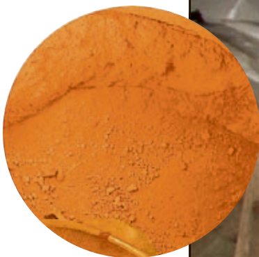
OKERFARGE: Arvet etter farfar.