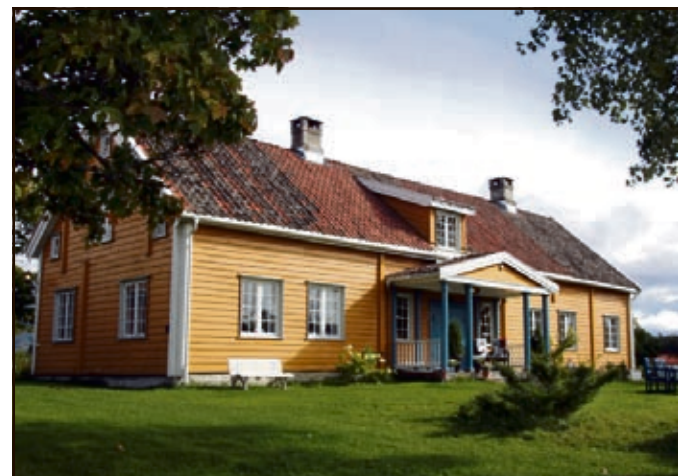
PRESTEENKETET SJO: Hovedbygningen ble fredet i 1923.