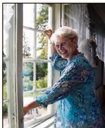
VINDUSSPROSSER: Et av sommerens gjøremål er kitting av de originale vinduene.