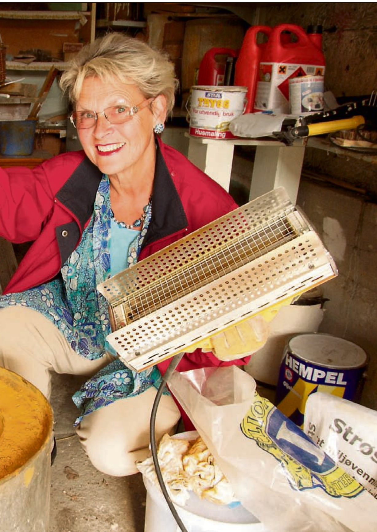
lette lampen er et godt arbeidsverktøy når gammel maling og kitt skal fjernes.