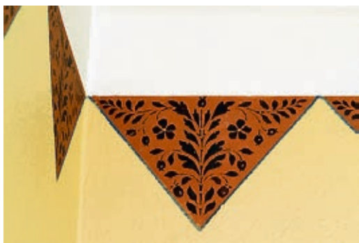
SJABLONMALING: Fra det nyrestaurerte taket i stua.