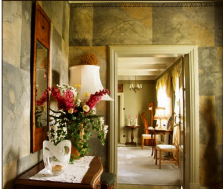
ORIGINALE VEGGER: Gangen har fortsatt original håndmalte marmorering fra 1795.