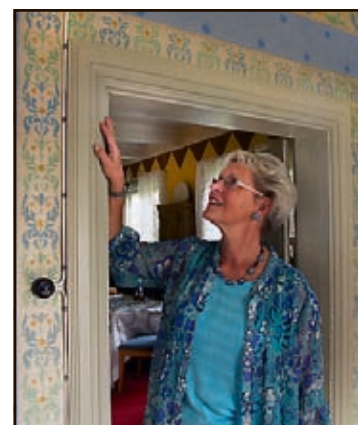
SJABLONMALING: Vakre border rammer inn døråpningene.