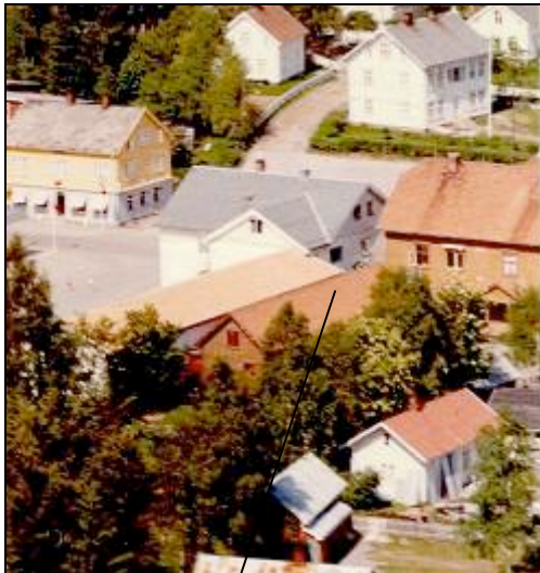
Den omsøkte bakgårdsbygningen.