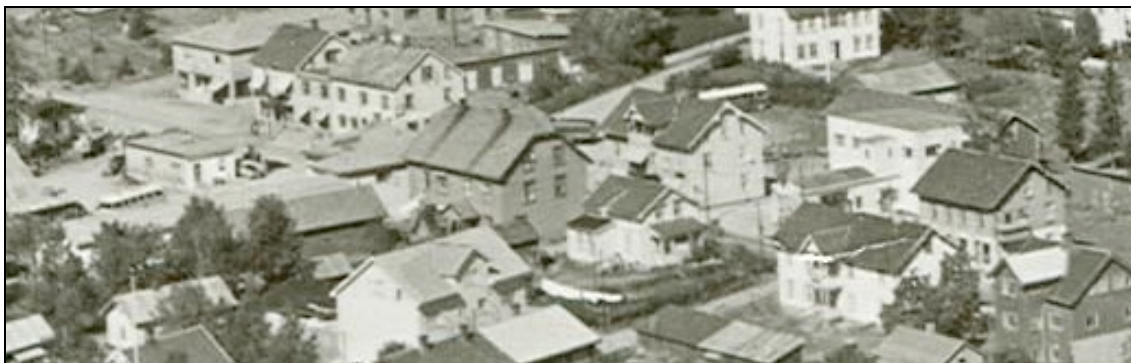
Storgata fotografert på 1960-tallet, med nr. 45 midt i bildet med ½ valmet tak.

Da kan de historiske utviklingslinjer dokumenteres og vises fram, ”in situ”, på stedet.