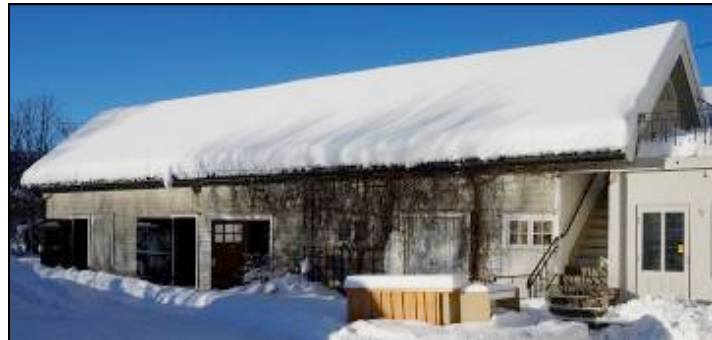
Bygninger skravert er søkt revet. Sammenbygd lagerbygning. DL, 2013.

Bygningene som er omsøkt revet er en kombinert lagerbygning med bygningsnr. 157817345 og en garasje med bygningsnr. 157772538.